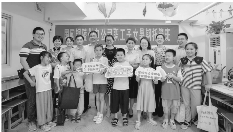
“全国爱心托班”国网铜陵供电公司职工子女托管班开展暑期托管服务