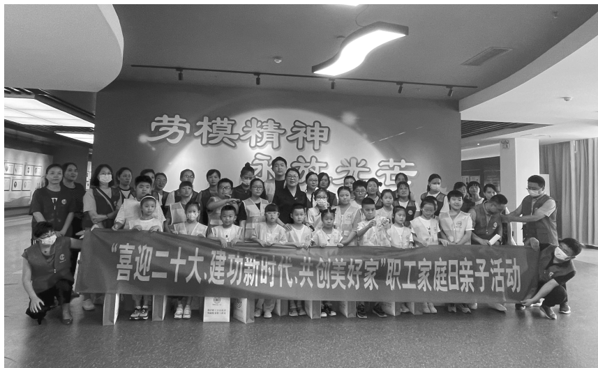
组织开展“喜迎二十大 建功新时代 共创美好家”职工家庭日活动