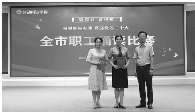
8月30日,举办“强国复兴有我 喜迎党的二十大”全市职工诵读比赛。

援助行动及“夏送清凉”、金秋助学、“冬送温暖”活动。大力实施困难职工帮扶民生工程,积极兑现各级劳模待遇。完善职工疗休养服务,发行职工“公园年票”,开展免费送体检活动,推深做实女职工“阳光家园”创建工作,率先开展市人民医院职工子女托育工作建设试点,赠送全市400名女职工“两癌”筛查体检。