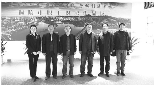
10 月 27 日,举办“喜庆二十大 建功新时代 劳动创造幸福”铜陵市职工摄影作品展。

创新“工会+部门”工作机制,扎实做好维护劳动领域维护政治安全工作。在做好劳动领域维护政治安全工作基本要求的基础上,主动作为、创新思路,建立健全部门联动机制。建立“工会+信访”信访联络机制、“工会+人社”的劳动纠纷调解机制、“工会+法院”的诉调对接机制、“工会+民政”帮扶解困机制,与市民政局建立困难职工帮扶救助信息共享机制,对困难职工群体进行精准识别、精准救助。