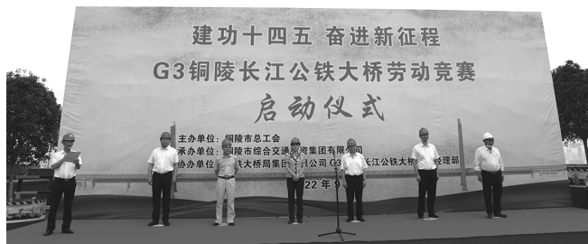
9月9日,举办“建功十四五 奋进新征程”G3铜陵长江公铁大桥劳动竞赛。