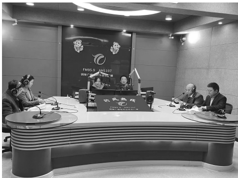
市总工会参加行风热线上线活动