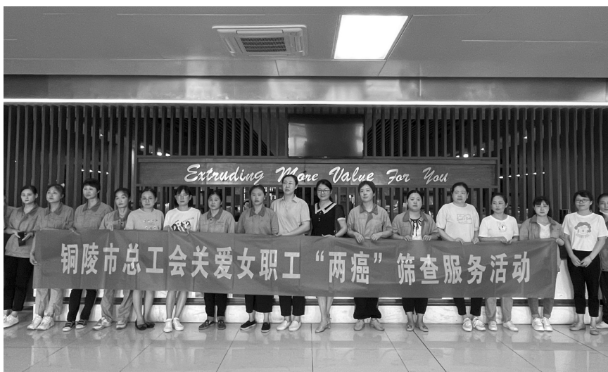
开展关爱女职工“两癌”筛查服务活动

深化“女职工维权行动月”活动,深入开展“情系女职工 法在你身边”普法宣传活动,采用“线上”宣传、“线下”进企业宣讲相结合的方式,不断增强女职工依法维权的能力和意识。推出“喜迎二十大 巾帼共奋进”庆“三八”全市女职工权益维护知识竞赛,全市职工参与答题 3.5 万人次,大力提高了性别平等和女职工权益维护相关法律法规和政策的知晓率、普及率。推广《安徽省女职工权益保护专项集体合同(参考文本)》,引导企业开展集体协商、签订女职工权益保护专项集体合同,积极促进构建和谐稳定的劳动关系。开展女职工专项集体合同“春季邀约”活动,1400 余家企业签订了女职工专项集体合同,覆盖率达 92%,女切实保障了女职工的合法权益和特殊利益。依托市总工会权益维护法律服务志愿团、市职工服务中心、市总 12351 职工服务热线开设“女职工权益维护”专题咨询,及时为有需要的女职工提供法律援助服务。