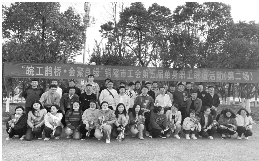
举办铜陵市工会第五届单身职工联谊活动(第二场)