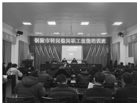
召开铜陵市转岗职工技能培训班