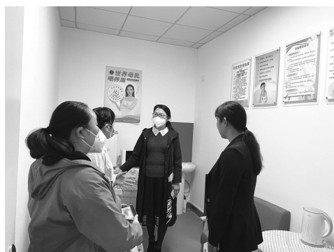
检查指导铜官区“阳光家园”建设工作