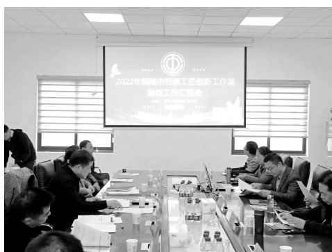
召开 2022 年铜陵市劳模工匠创新工作室验收工作汇报会