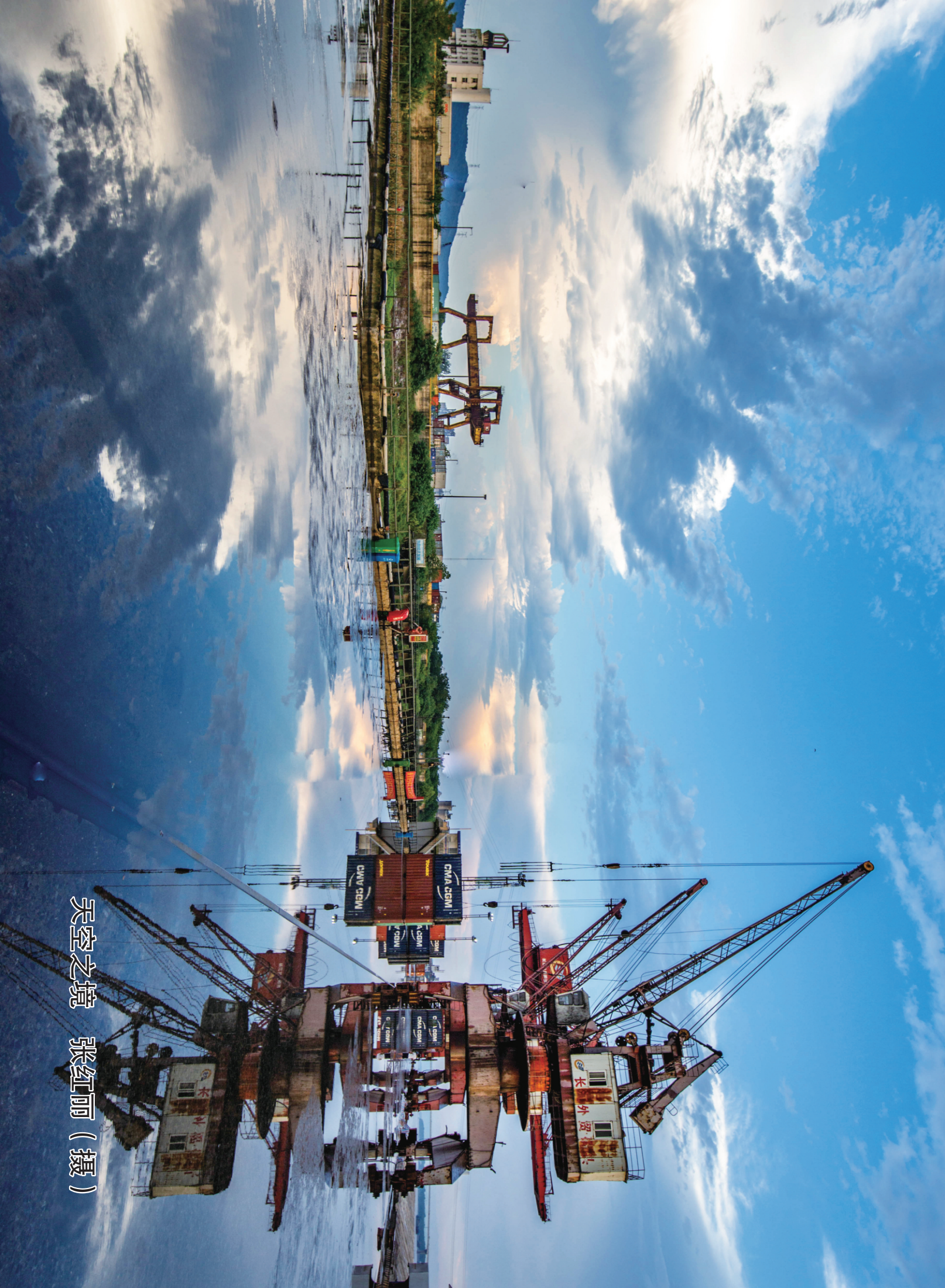
天空之境