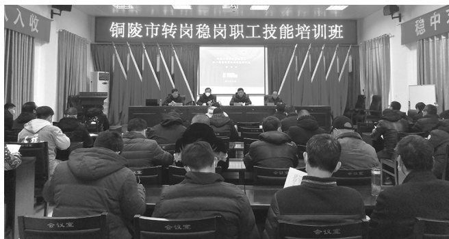
12月16日市转岗稳岗职工技能培训班开班。