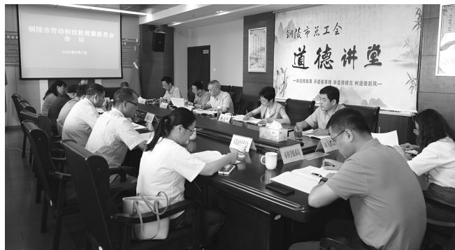
9月7日,召开铜陵市劳动和技能竞赛委员会会议。